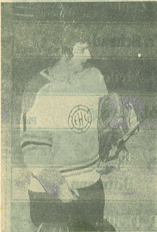
Der «Zauberer von Davos»

(f-s) Die Davoser brauchen sich nach dieser Niederlage nicht zu schämen. Gegen «Zauberer» Maier im Churer Gehäuse war an diesem idealen Winterabend im stimmungsvollen Davoser Stadion einfach kein Kraut gewachsen. Was der wieselflinke Routinier alles wehrte, welche Boliden er blockierte und wie er mit nachtwandlerischer Sicherheit stets die richtige Position ein-