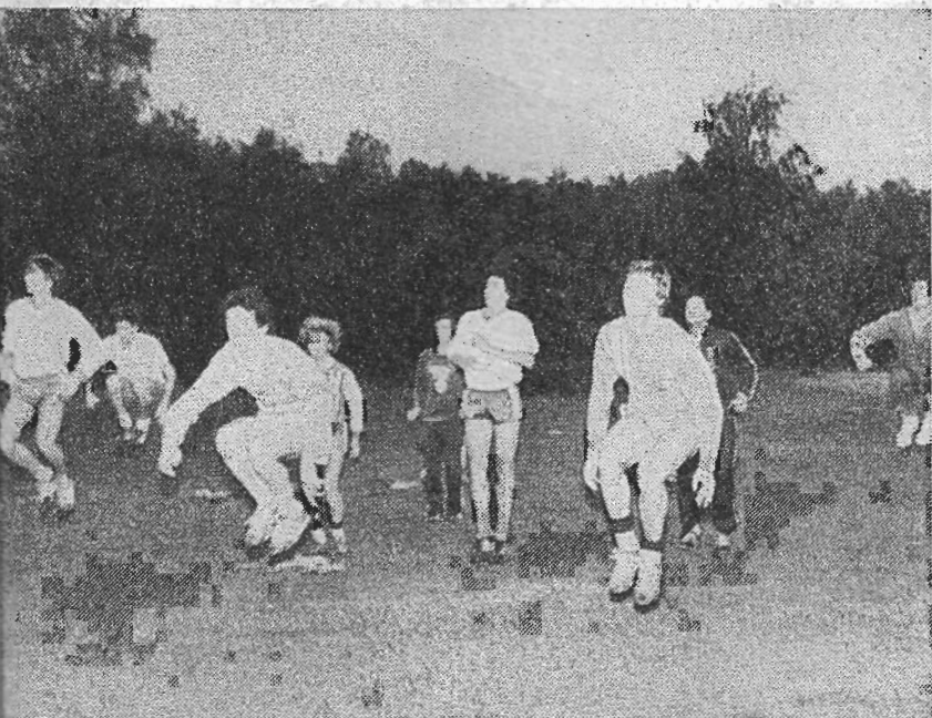
Am Konditionstraining auf der kleinen Wiese hinter der Finnenbahn auf der Oberen Au.