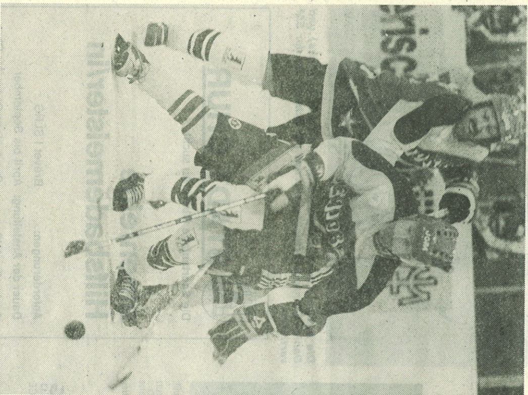
Die St. Moritzer Senioren fingen Cupverteidiger Chur im letzten Spiel noch ab.

1. Bülach Select 6 Punkte. 2. Chur 5. 3. Luzern 5. 4. Ravensburg 2. 5. St. Moritz 2.