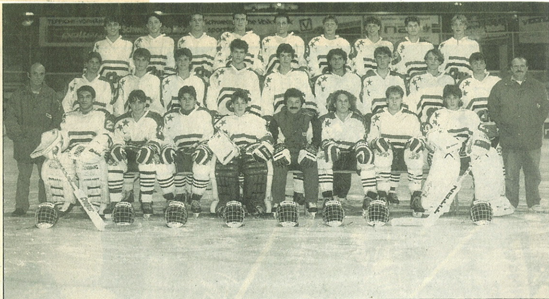
Sind Churs Junioren auf dem Weg zum Meistertitel?