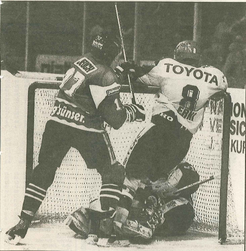
Chur-Verteidiger Jeuch geht auf Erni los – Torhüter Bachschmied ist das Opfer