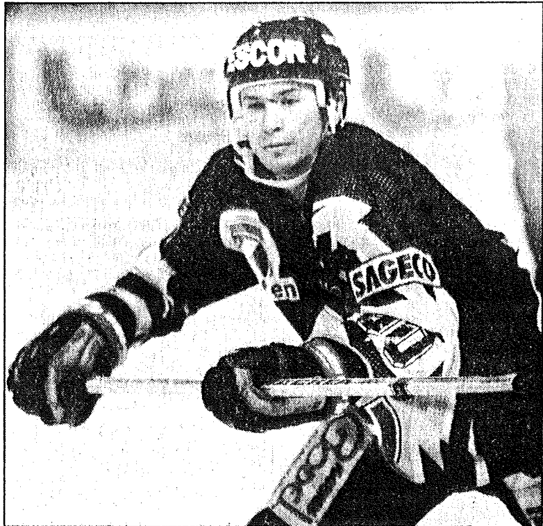
Will Chur heute gegen die Cadieux-Truppe zum Erfolg kommen, muss es die Wirkungskreise von Fribourg-Spielmacher Slawa Bykow einengen.

schaft zu erkämpfen. Der «Junioren-Nati-Zug» scheint hingegen am Churer Nachwuchsspieler vorbeizufahren. Für das Vierländer-Turnier von kommender Woche hat er kein Aufgebot erhalten. Und die nächsten Junioren-Weltmeisterschaften würden dem KV-Lehrling ohnehin terminliche Probleme bringen. Internationale Nachwuchs-Titelkämpfe haben ihm schon bisher kein Glück gebracht. Letztes Jahr hatte er auf die Europameisterschaften mit der Schweizer U18-Auswahl wegen einer