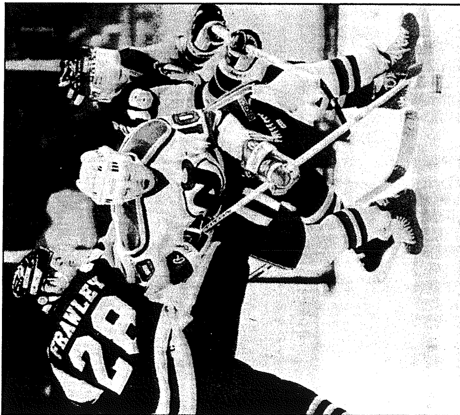
700 NHL-Schlachten auf dem Buckel: Broten mimt's auch mit zwei Penguins auf