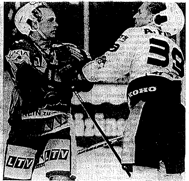
Gehören zu einem richtigen Playoff-Match wie der Puck zum Eishockey: Hektik (Bild links) und Härte (Bild rechts).