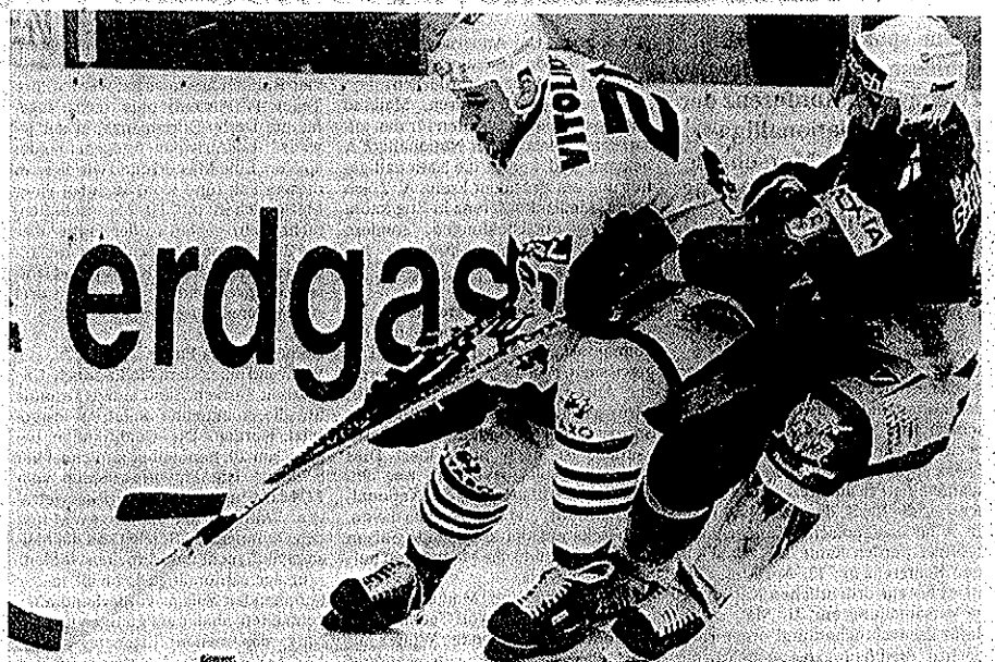
Der EHC Chur und die Grasshoppers liessen sich am Samstag wenig Raum: Die Zweikämpfe waren deshalb überaus zahlreich.