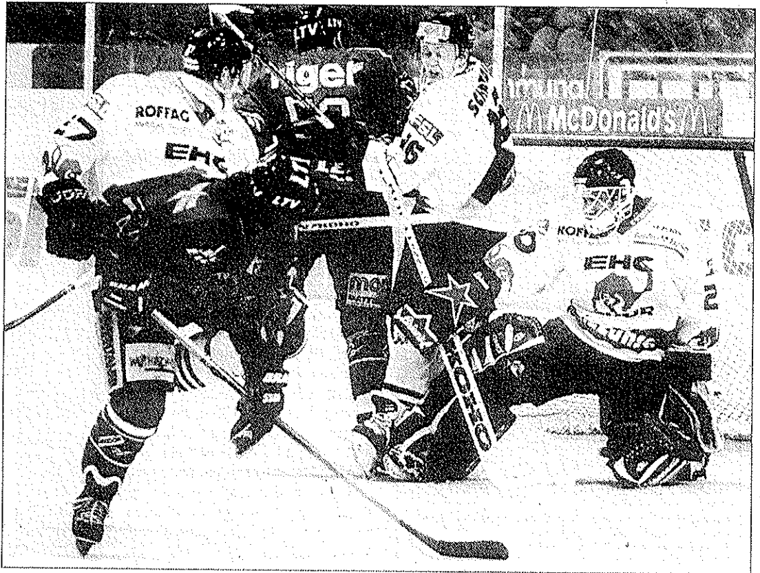
«Tiger» Roland Kradolfer skort zum 1:1 - der Churer Torhüter Thomas Liesch hat das Nachsehen.

Plötzlich erwachten die Churer, holten Tor um Tor auf - wobei